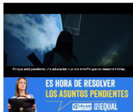
Proyecto más ganador: una educación que nos ayude a no volver a estar.

ES HORA DE RESOLVER LOS ASUNTOS PENDIENTES